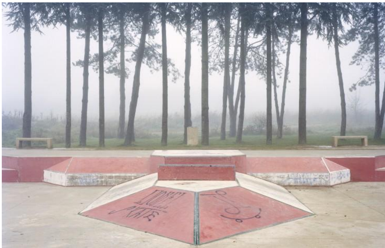
Skatepark à Magny-les- Hameaux (Yvelines). 2016