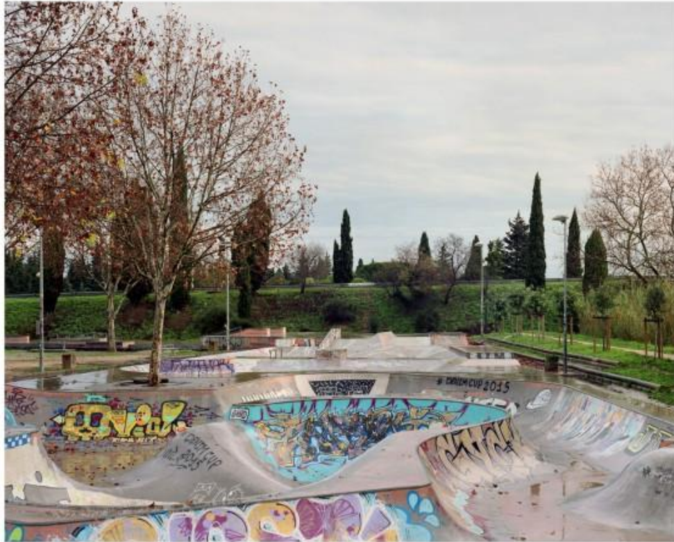
Skatepark à Ni#mes (Gard). 2016

A Bordeaux, l'accent est mis sur la capacité des skateurs à investir la ville dans ses lieux les plus emblématiques mais aussi dans ses interstices. Des piscines vides utilisées lors des épisodes de sécheresse en Californie au pipeline de Mount Baldy jusqu'aux sculptures de Robert Morris, leur imagination semble sans limites.